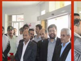
برگزاری مراسم ۷ مهر ماه روز آتش نشان