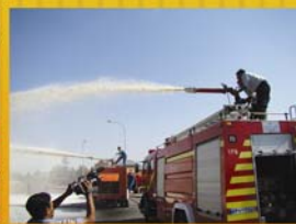
شرکت در مانورها برای آمادگی بیشتر